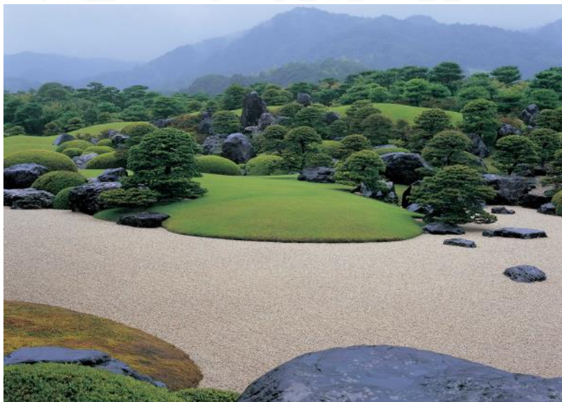
足立美術館 枯山水庭イメージ