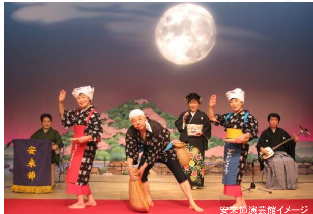
安来節演芸館イメージ